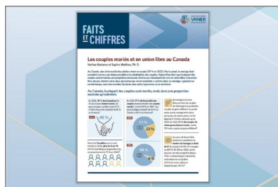
Faits et chiffres : Les couples mariés et en union libre au Canada

Les feuillets de renseignements et les fiches infographiques paraissent sous forme de brèves publications d'une ou deux pages remplies de renseignements essentiels à propos de sujets liés au Cadre sur la diversité et le bien-être des familles.