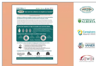
Fiche infographique : Qui sont les aidants en emploi au Canada?